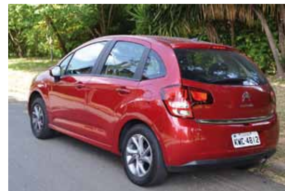
Nova lanterna traseira deixou modelo mais sofisticado

Com motor 1.5 litro e 8 válvulas, o modelo avaliado desenvolve potência máxima de 93 cv (etanol) a 5.500 rpm, e torque máximo de 14,2 kgfm a 3.000 rpm, o que o torna a melhor opção para quem transita a maior parte do tempo em circuitos urba-