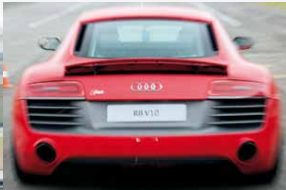
A traseira guarda o motor V10 que agora tem 550 cv de potência