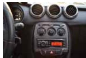
No console, três saídas de ar; o retrovisor parece flutuar no ar e nova traseira mais elegante

Estes equipamentos estão disponíveis a partir da versão intermediária 1.5i Manual Tendance, que custa R$ 47.950, segundo tabela Fipe, e vem ainda com faróis de neblina traseiros, indicador de temperatura externa, som com USB, bluetooth e comando na direção, vidros elétricos na dianteira e