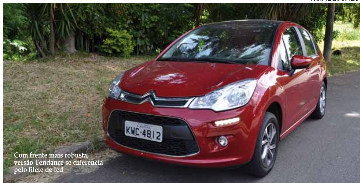
Com frente mais robusta, versão Tendance se diferencia pelo filete de led

traseira, rodas de liga leve de 15 polegadas, retrovisores na cor da carroceria, e outros pequenos detalhes estéticos.