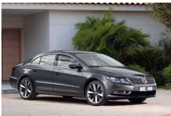
No CC, a redução de preço foi de R$ 23.150

com motor 4.2 FSI de 360 cv e transmissão automática de oito marchas, passa a ser comercializado a