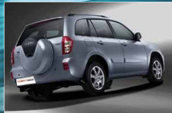
Na traseira, destaque para lanternas em leds e capa do estepe