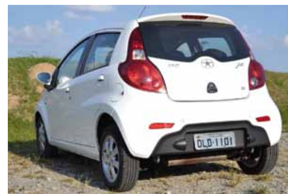
Lanternas enormes roubam a cena na traseira

inútil em um modelo hatchback tão curto.