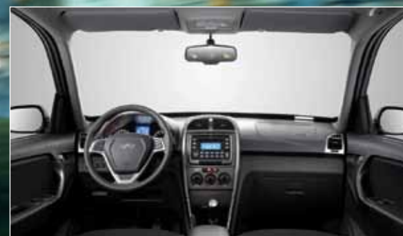
Acabamento interno evoluiu, mas ainda precisa melhorar

Com design renovado, o SUV compacto chinês está mais moderno, porém o acabamento interno ainda precisa melhorar