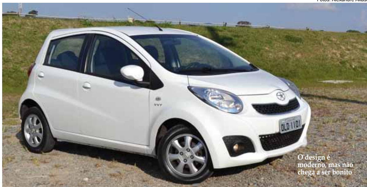
O design é moderno, mas não chega a ser bonito

O JAC J2 surpreendeu na semana de teste drive oferecido pela montadora. Pequeno e ágil, é ideal para o uso diário nos grandes centros urbanos, graças ao motor 1.4 litro com comando de válvulas variável, que rende 108 cv de potência e torque máximo de 14,1 kgfm, ao tamanho