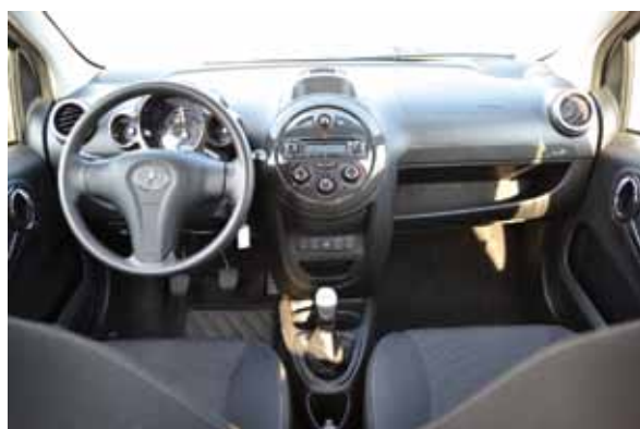
Painel simples, faltou medidor de temperatura do motor

rações e facilidade de manobra torna o J2 agradável de dirigir, o que reflete no consumo, que ficou em torno de 8 km/l na cidade, porém sempre com uma condução mais esportiva. A suspensão é macia, absorve bem as irregularidades, e podia até mesmo ser um pouco menos mole. JFA