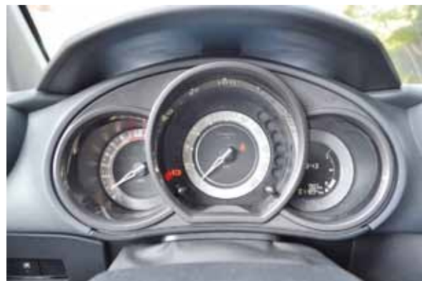
Painel mais elegante, porém faltou termômetro do motor

delo anterior, e o painel com novo grafismo ficou mais sofisticado do que o antigo, com velocímetro digital. A única crítica é a ausência do indicador de temperatura do motor, item que deveria ser indispensável a todos os veículos, e principalmente para um modelo da categoria premium. FA