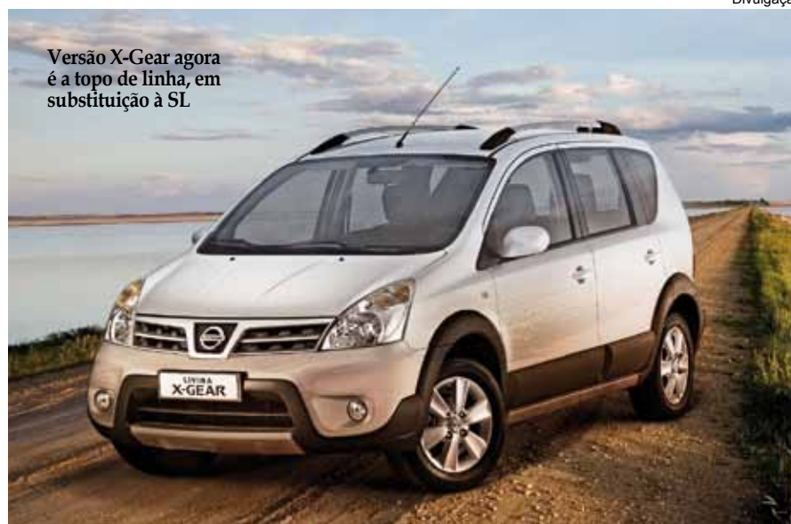
Versão X-Gear agora é a topo de linha, em substituição à SL

A topo de linha X-Gear vem com apliques laterais, para-choques e grade e rodas exclusiva, câmbio automático, bancos e volante de couro, ar-condicionado digital, I-Key (chave presencial, faróis de neblina e maçanetas pintadas na cor do veículo. JFA