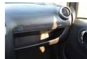
Porta-malas pequeno, 121 litros, assim como os relógios ao lado do velocímetro e porta-luvas

Feito para andar na cidade, o subcompacto chinês surpreende pela agilidade, graças ao motor 1.4 litro